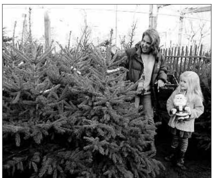
• Samen met moeder een mooie kerstboom uitzoeken bij de Intratuin

Van een onzer verslaggevers AMSTERDAM - Intratuin heeft ondanks alle financiële perikelen ook deze kerst weer uitermate goede zaken gedaan. Nederlandse consumenten trokken massaal naar de 'winterfestivals' omgebouwde tuincentra. Daardoor werd de recordomzet van vorig jaar weer overtroffen en kwam de omzetterler maar liefst 4% hoger uit.