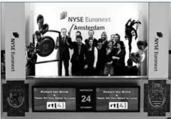
• Aan de vooravond van Kerstmis opende Robert ten Brink afgelopen woensdag de handel op de Amsterdamse beurs. Hij leidde daarmee meteen de laatste - en verkorte - handelsdag van de week in. De RTL-presenteraar had het volledige team van All You Need Is Love opgetrommeld voor de slag op de tong. Ten Brink trekt op kerstavond traditiegetrouw weer het land (en het buitenland) in om hartven te verwarmen met een aantal herenigingen. De kerstspecial van het programma, dat al sinds 1992 op de buis is, trekt ieder jaar weer miljoenen kijkers.